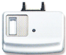
optionales Zubehör MXE-60 Flash